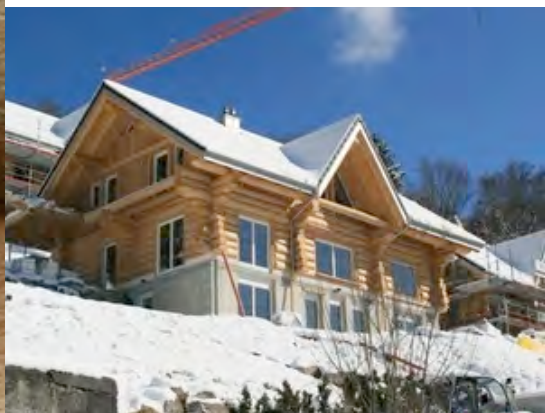
So ungefähr sieht unser Haus aus wenn es fertig ist. Dies ist das Haus von Toblers - unseren Nachbarn