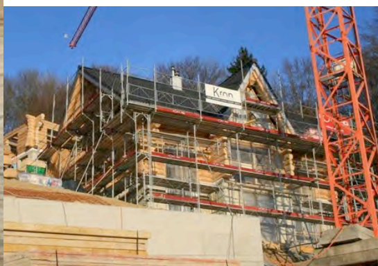
Dies ist das Haus das wir bauen.